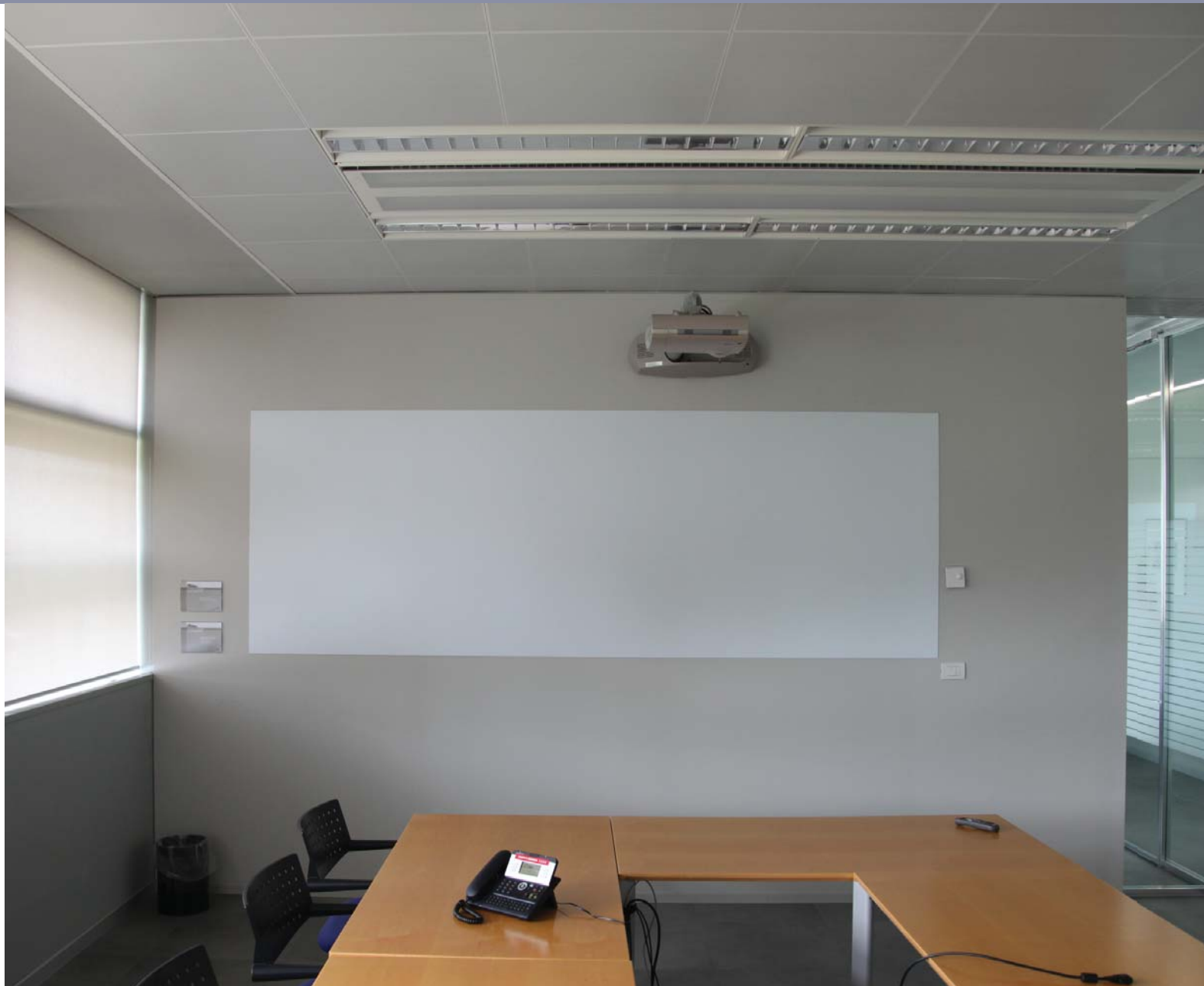
Lámina para pizarra blanca 3M™ Whiteboard WH-111

La lámina WH-111 está compuesta de un poliéster blanco con adhesivo y acabado brillo. Se utiliza como pizarra blanca. Si se usa con rotuladores base agua, la escritura y los dibujos se pueden borrar fácilmente. Su acabado superficial de alto brillo permite que la escritura deslice con suavidad. Es más ligera que las tradicionales pizarras blancas autoportantes. Debido a los reflejos que genera no se recomienda como pantalla de proyección. Para usar exclusivamente en interiores sobre superficies planas.